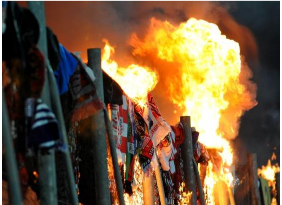
Hooligans nutzen den Fußball als „Bühne“ für Gewalt.

Die drei Männer hatten die Vorwürfe zugegeben, im Saal gezeigte Videoaufzeichnungen der Polizei hätten ihnen auch wenig andere Möglichkeiten gelassen. In der Halbzeit waren die drei in dem aggressiven Mob am Zaun zum Lautern-Bereich offenbar zufällig zusammengekommen. Er sei eigent-