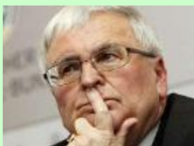
Dr. Theo Zwanziger